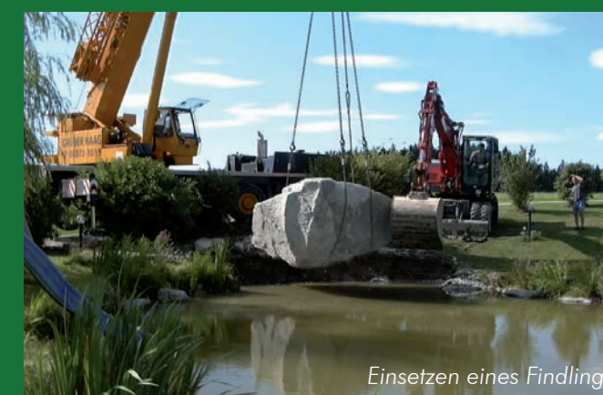
Einsetzen eines Findlings