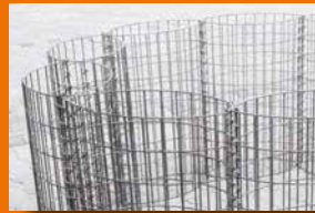
Rund- oder Säulengabionen