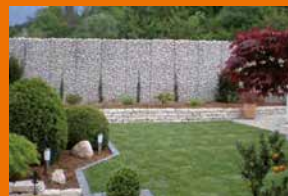
Gittec Die Mauer aus Draht